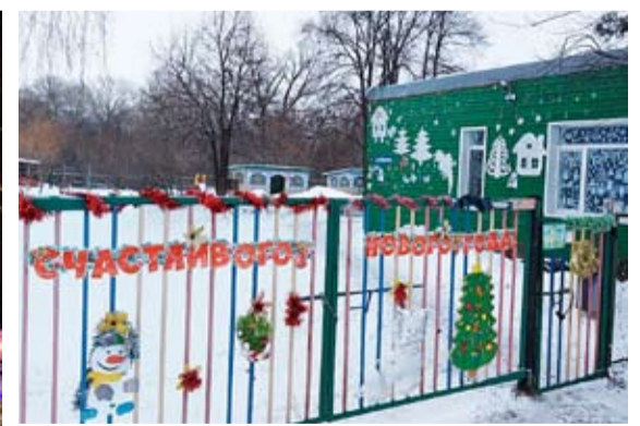
3 место - сельское поселение Спиридоновка.

По информации инспекции по охране окружающей среды администрации м.р. Волжский.