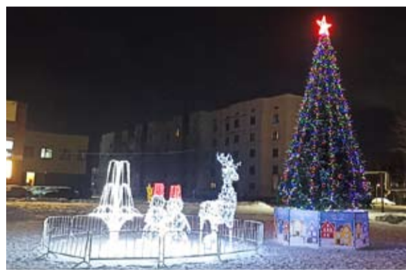
1 место - городское поселение Рощинский.