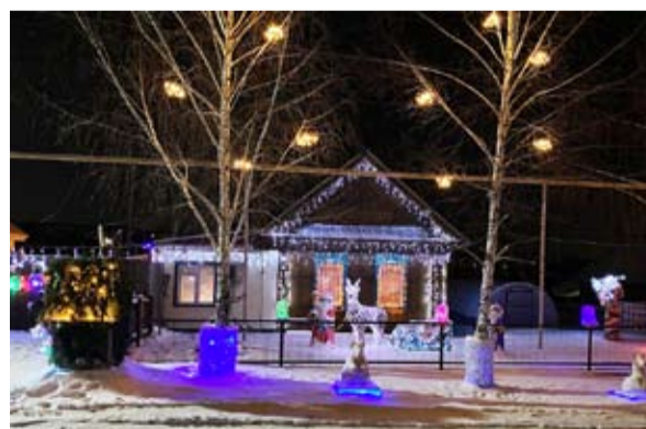
2 место - сельское поселение Курумоч.