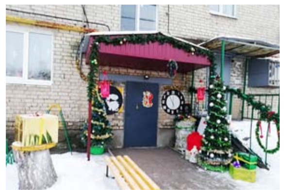
1 место - сельское поселение Верхняя Подстепновка.