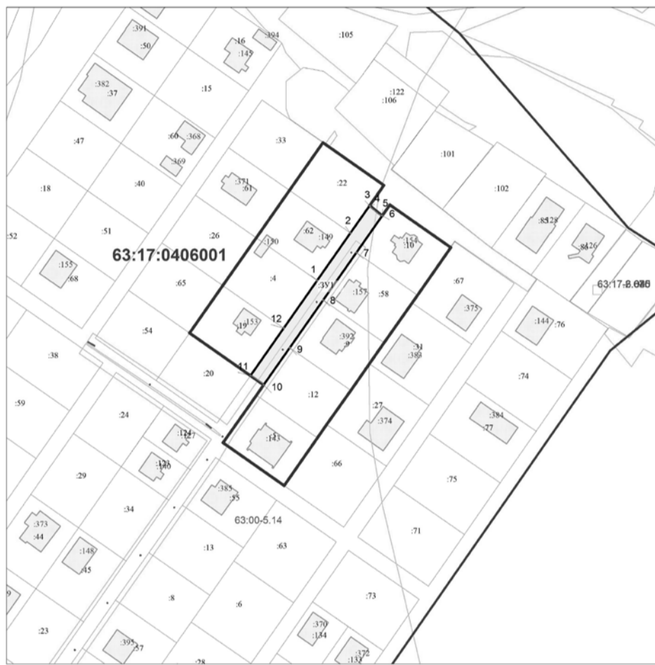
Чертеж межевания территории