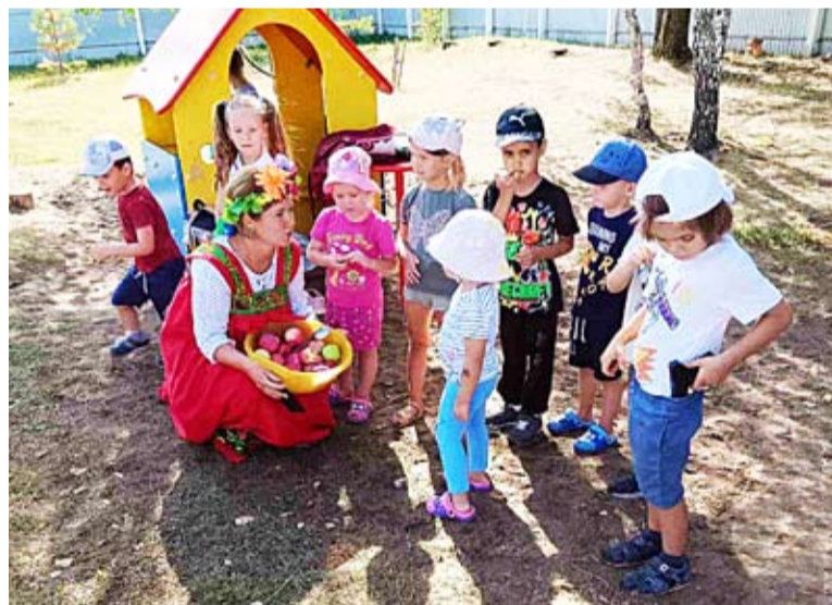
В поселке Калинка отметили Яблочный Спас. Сотрудники Дома культуры познакомили малышей с народными праздниками, их традициями и угостили их вкусными и полезными яблочками.