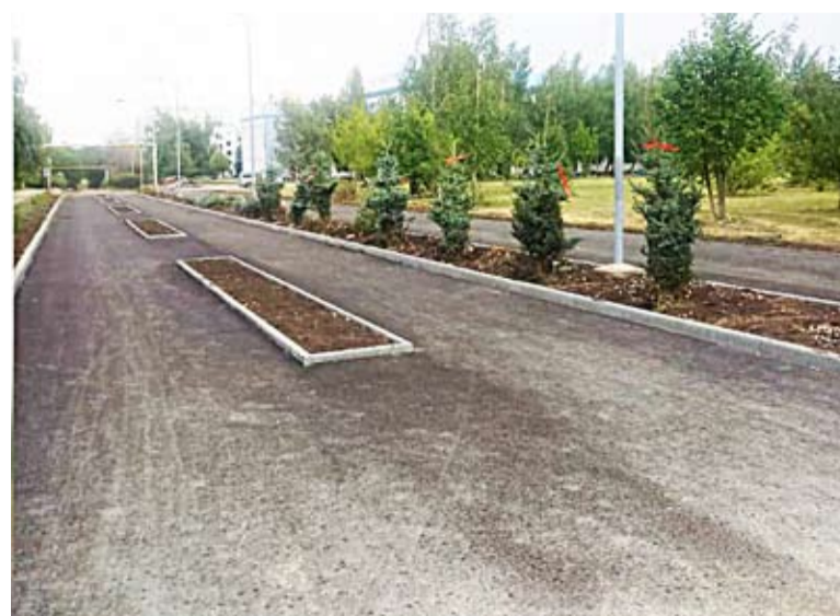
Продолжаются работы по муниципальной программе «Формирование комфортной городской среды». На Аллее Славы в поселке Рошинский высадили 57 елей. В будущем году здесь намерены установить стелу во славу военнослужащих.