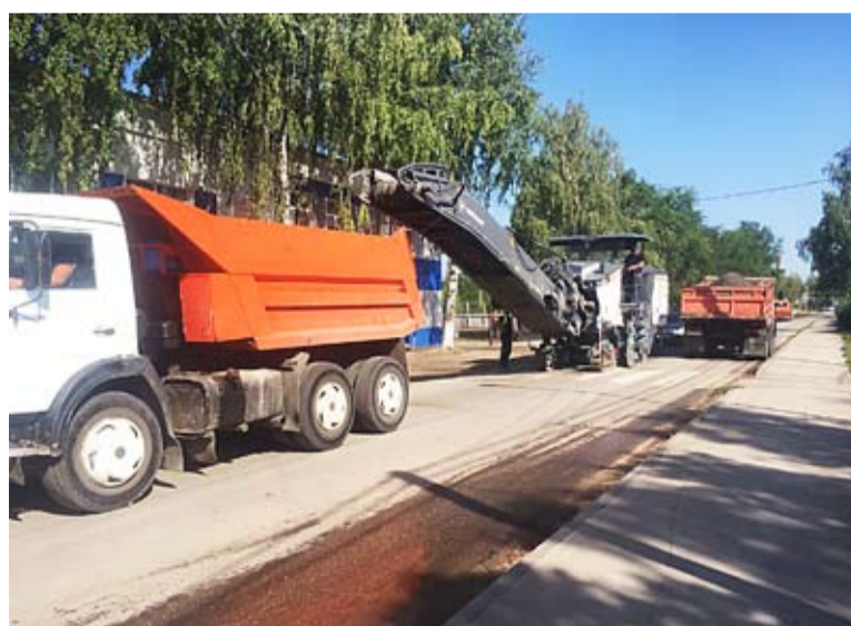
В Петра Дубраве идет ремонт дорожного покрытия на улице Физкультурной. Всего в этом году в Волжском районе будет отремонтировано 9 км 916 м автомобильных дорог общего пользования местного значения.