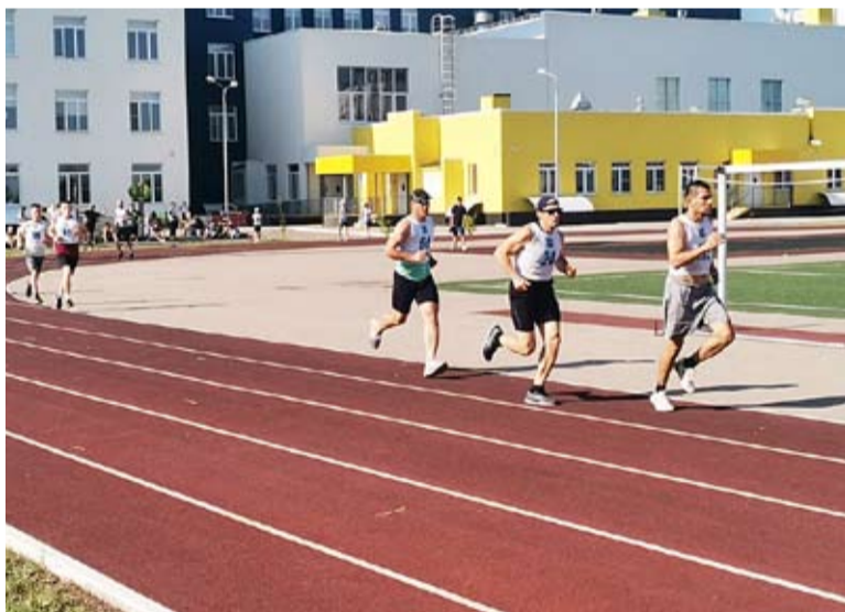
В ОЦ «Южный город» прошло традиционное командно-личное первенство по легкой атлетике в рамках XVI Спартакиады среди жителей сельских и городских поселений Волжского района.