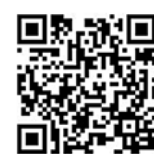
Информация для кандидата

Более подробную информацию Вы можете узнать, позвонив по телефону: 8 917 016-90-41, 8 996 746-42-02 или 8 846 332-39-37.