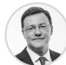
ДМИТРИЙ АЗАРОВ, губернатор Самарской области

« Наши аграрии вносят огромный вклад в продовольственный суверенитет и продовольственную безопасность нашей страны »