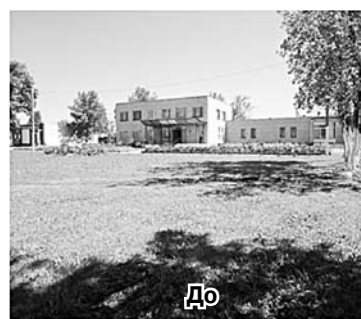
Установка уличной сцены СДК «Нива» п. Верхняя Подстепновка.