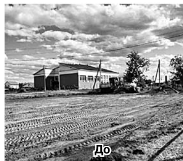
Устройство детской игровой площадки п. Просвет.