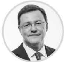
ДМИТРИЙ АЗАРОВ, губернатор Самарской области

« Планы огромные. И вместе мы справимся. У меня есть полная уверенность, мы все преодолеем, все сложности. И внешних врагов, и внутренних, и все проблемы, которые нам создают, и победим обязательно. Абсолютно в этом уверен, сомнений нет никаких »