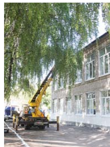
Сельское поселение Черновский.

движение детей и молодежи», бесплатная мобильная библиотека и обменный книжный фонд. В Год педагога и наставника - особое внимание педагогическим кадрам. Более десяти педагогов стали героями стенда «Вчера - ученик, сегодня - учитель», еще один итог проектной деятельности - книга, посвященная ветеранам педагогического труда школы, рядом - памятная книга о педагогах-ветеранах Поволжского образовательного округа «В памяти нашей их имена...».