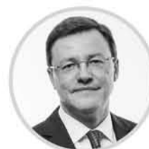
ДМИТРИЙ АЗАРОВ, губернатор Самарской области

« Последние годы в нашем регионе сотни дворов и зон отдыха приводятся в порядок, ведется работа по оздоровлению Волги. Мы будем и дальше благоустраивать родную землю, чтобы создать комфортные условия для каждого жителя »