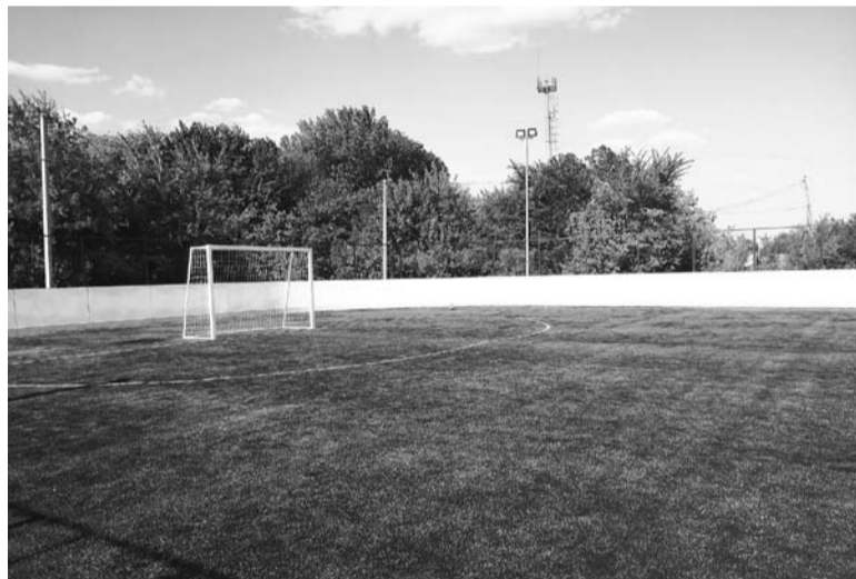
Универсальная спортивная площадка построена в поселке Черновский.

По информации с сайта Правительства Самарской области.