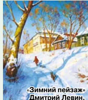
«Зимний пейзаж» Дмитрий Левин.

11 февраля возможен дождь со снегом. Температура воздуха днем -2...0, ночью -2...-1. Ветер юго-западный, 3-4 м в секунду. Атмосферное давление 750-755 мм рт. ст.